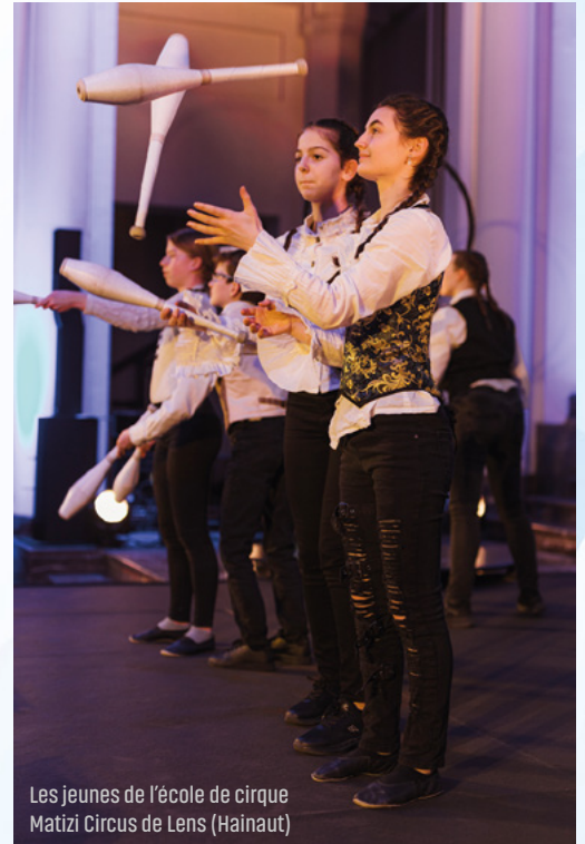
Les jeunes de l'école de cirque Matizi Circus de Lens (Hainaut)