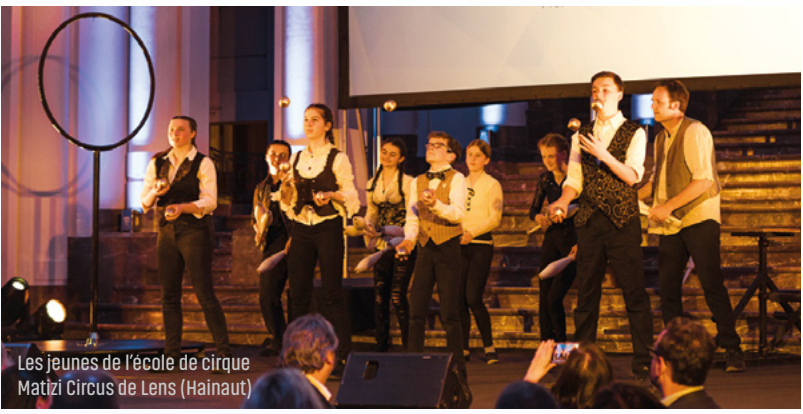
Les jeunes de l'école de cirque Matzi Circus de Lens (Hainaut)