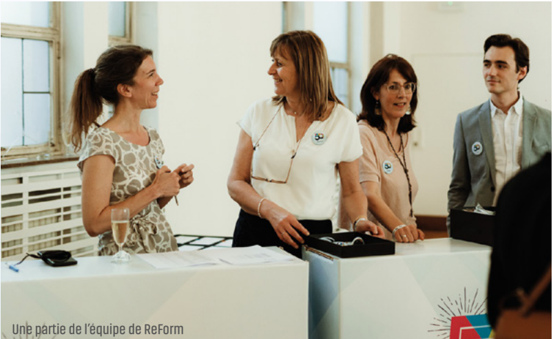
Une partie de l'équipe de REFORM