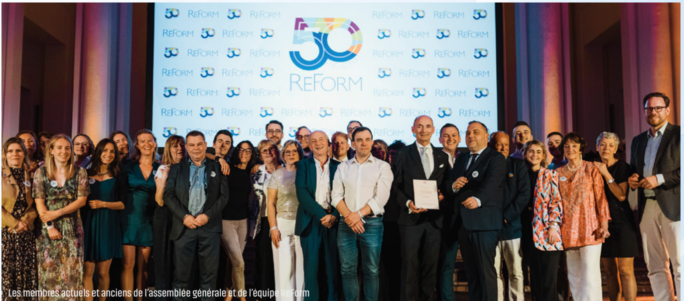
Les membres actuels et anciens de l'assemblée générale et de l'équipe ReForm