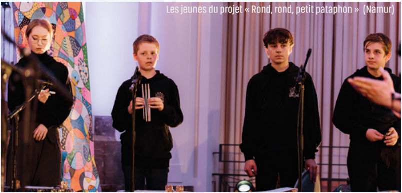
Les jeunes du projet « Rond, rond, petit pataphon » (Namur)