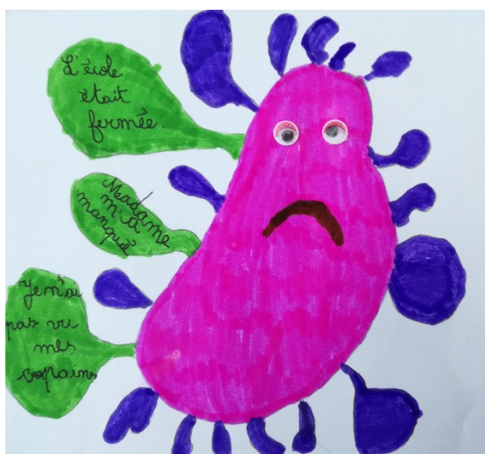
Dessin réalisé par Louise, Ecole des CRACS de Silly

La motivation des jeunes et de nos équipes a permis la réalisation de nombreux projets. Certaines adaptations ont dû être effectuées en fonction des différents protocoles à respecter. Une attention particulière a également été apportée aux jeunes en décrochage scolaire.