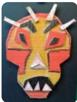
Tableau africain. Création d'un tableau représentant un masque africain en s'inspirant et en exprimant différentes émotions avec du carton et des pastels gras.

En Musique. Création d'une mini-guitare à base de matériaux de récupération.