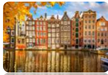
Deux jours à Amsterdam