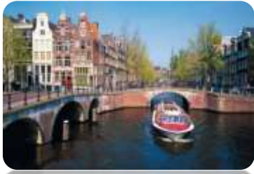
Un Jour à Amsterdam

Visites de musées et/ou de monuments célèbres